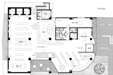
First Floor Plan Scale 1:800