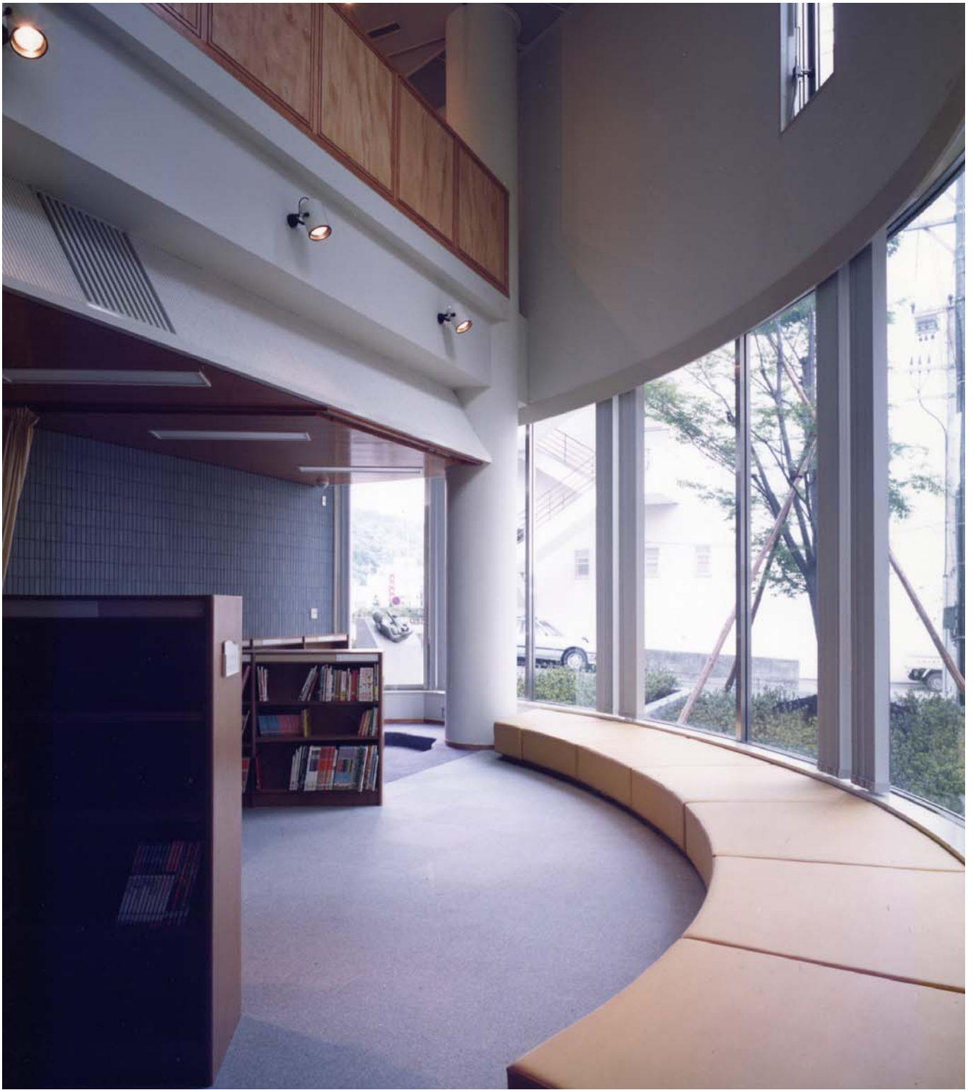
児童コーナー children corner