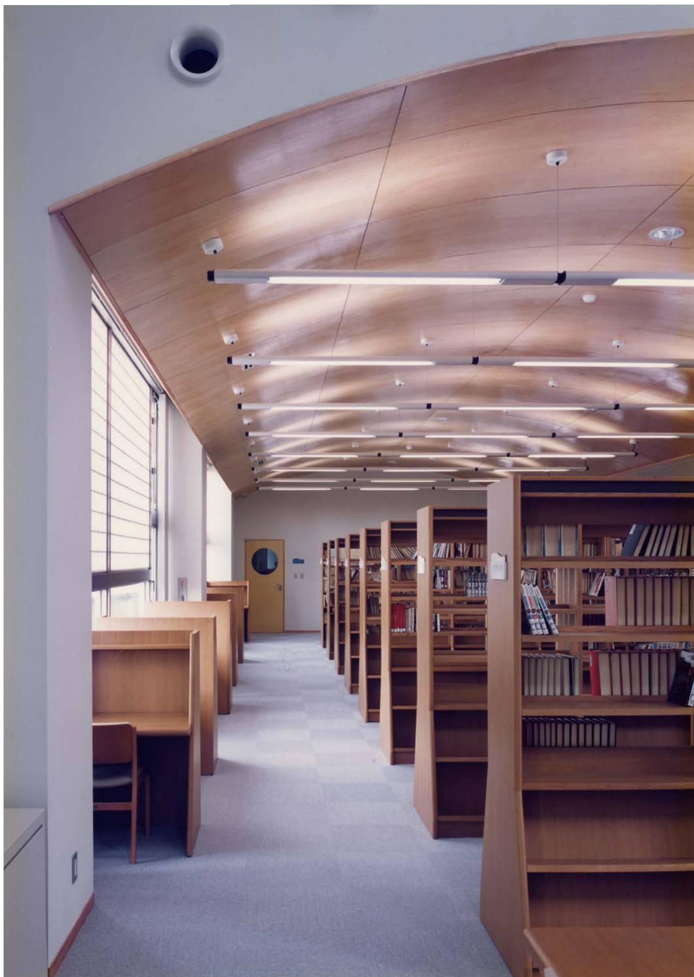
図書スペース reading space