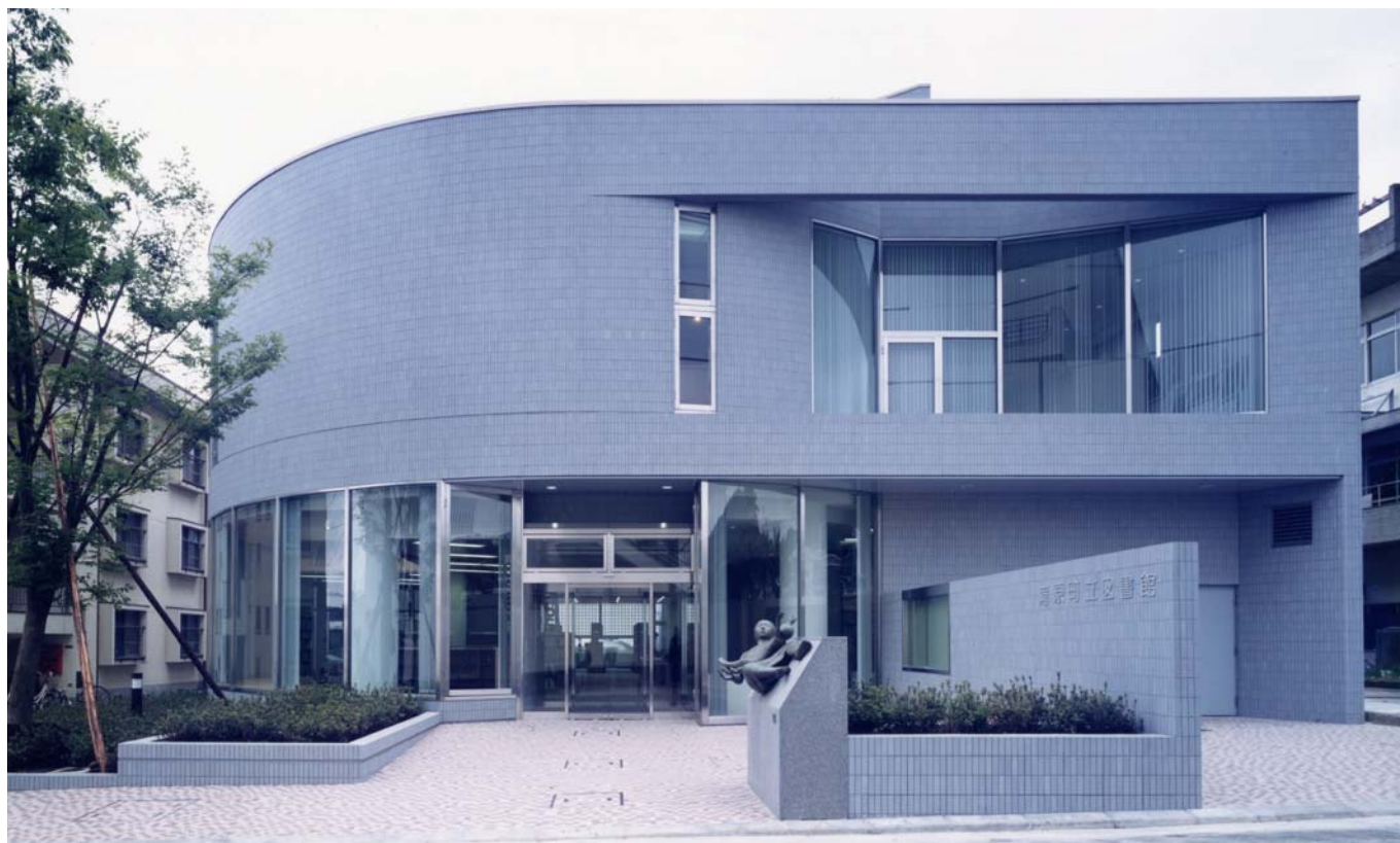
東側外観 view from east

Kanbara Town Library and Historical Museum