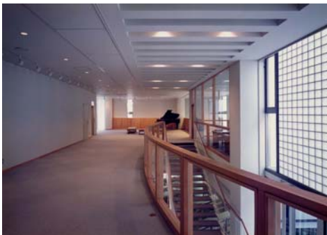
展示ギャラリー exhibition gallery Site Plan