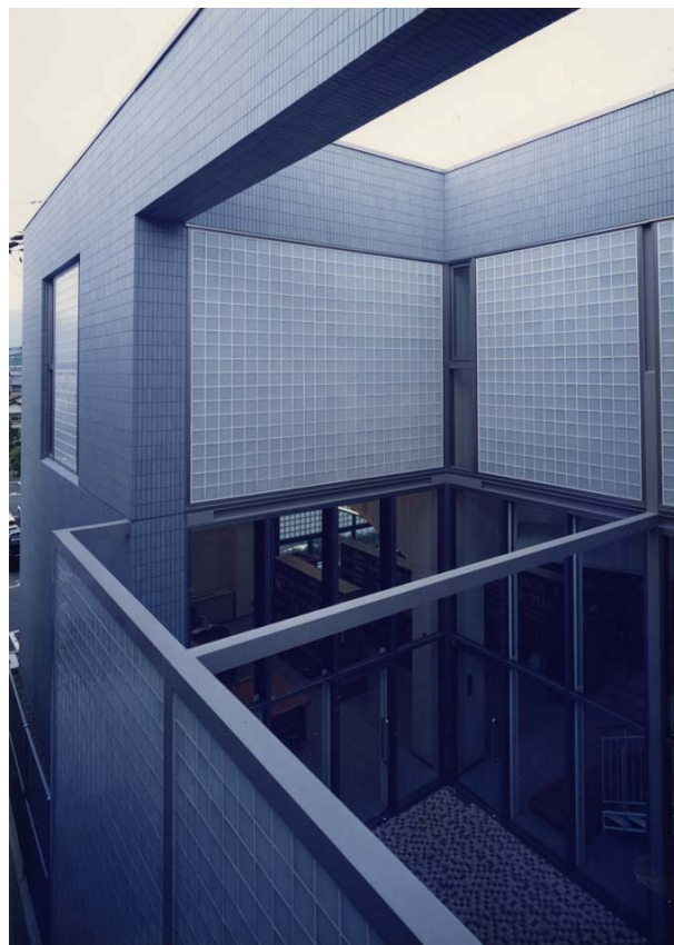
読書テラス terrace for reading

The exterior appearance of this building, located by the seashore of the deepest part of Suruga Bay, is made of rhythmical walls and glass, and we used bluish gray ceramic tiles for exterior. The approach to the building is clearly separated for users and bookmobiles. Near the entrance we designed a children's corner with a curved wall and newspaper and book corner, giving the impression of an "open library". To take in natural light, we used glass blocks and designed a reading terrace and a "light void". At the reading terrace, we arranged a space between the reading spaces of adults and children to block out noise generated by the children, and at the same time to provide a common reading space for parents and children, which may be used as a cafe terrace in the future. The "light void" and wooden vault ceiling give different impressions depending on each corner, making it a flexible space.