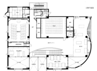
Second Floor Plan Scale 1:800