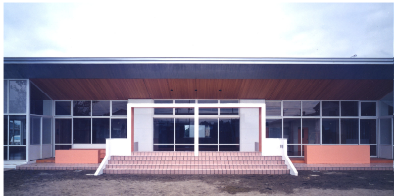
園庭よりみる view from playground