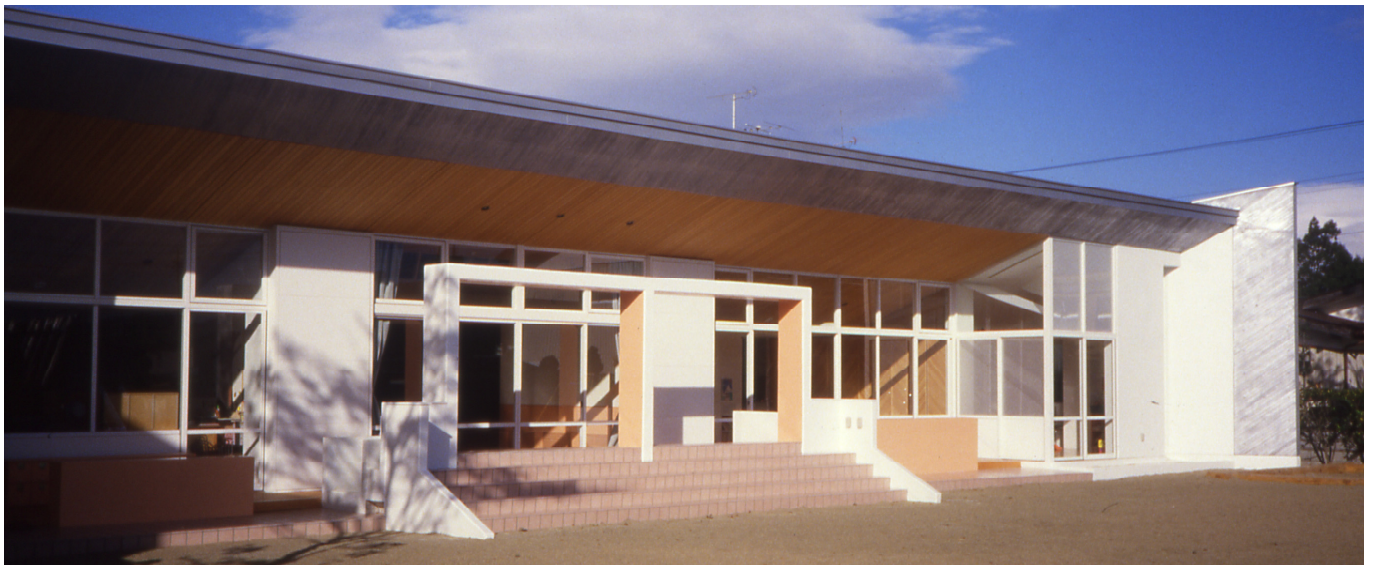
南側外観 view from south