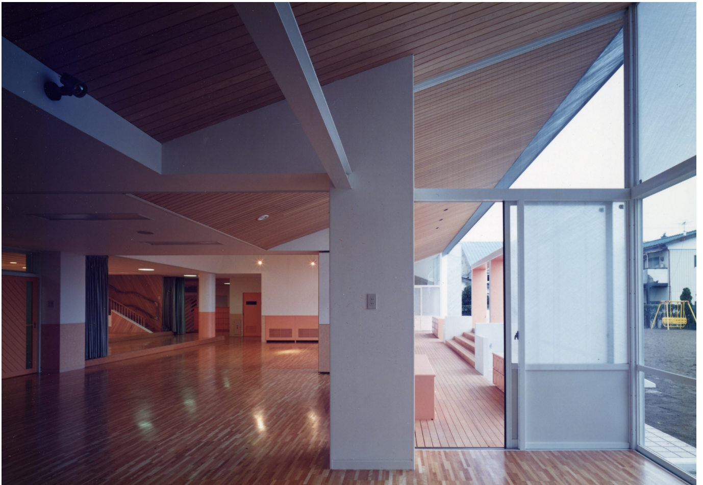
遊戯室をみる view toward playroom