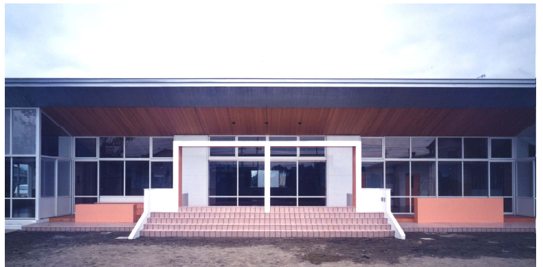
園庭よりみる view from playground