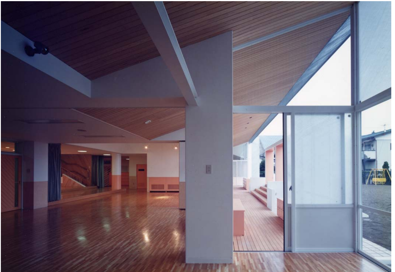
遊戯室をみる view toward playroom