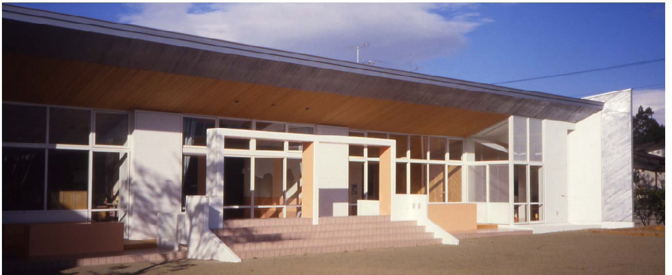
南側外観 view from south