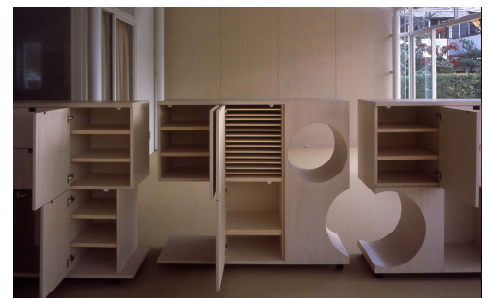
家具は分割できる furniture can be divided

This architecture is an extension of a nursery school affiliated with Ohta Nishinouchi Hospital. Because light at the child care room side had to be blocked during the construction period, roof panels and bolted connection were used to minimize the construction period. The extension has a combination of opaque and translucent ceilings, which make the space look like an "engawa" added to the existing architecture. The addition of this extension blurs the border between the inside and the outside. An intermediate space between the inside and the outside was created, where people feel as if the child care room has been extended outside, and also feel as if the playground comes into the child care room. As a result, the children can conduct activities continuously in the internal space and at the playground.