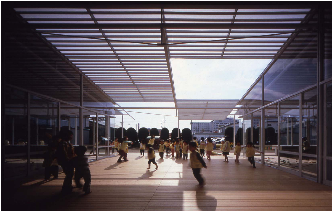
新設木製テラスをみる view toward wooden terrace

建築概要：主要用途 main use：保育園 nursery school 敷地面積 site area：990.12㎡ 建築面積 building area：112.00㎡ (TOTAL 528.57㎡) 延床面積 total floor area：112.00㎡ (TOTAL 673.86㎡) 掲載誌：新建築2006年1月号, GA JAPAN 78号