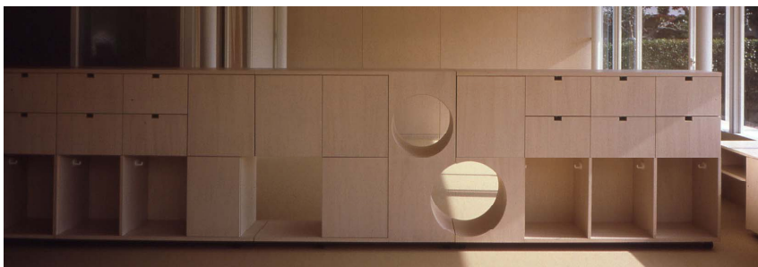
トンネル家具 tunnel furniture