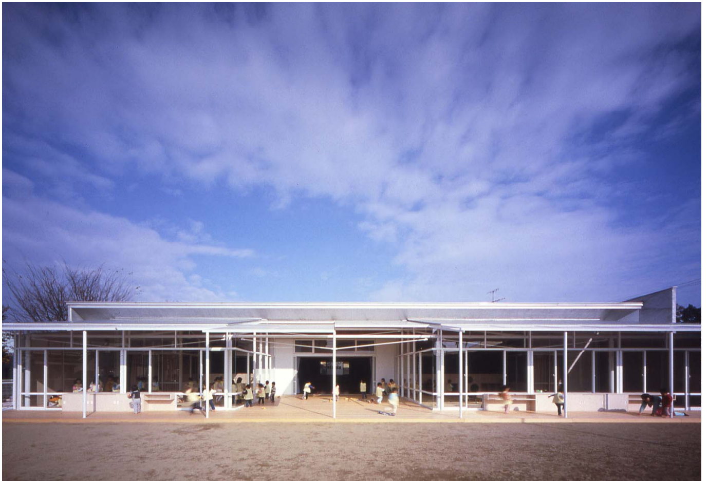
南側外観 view from south