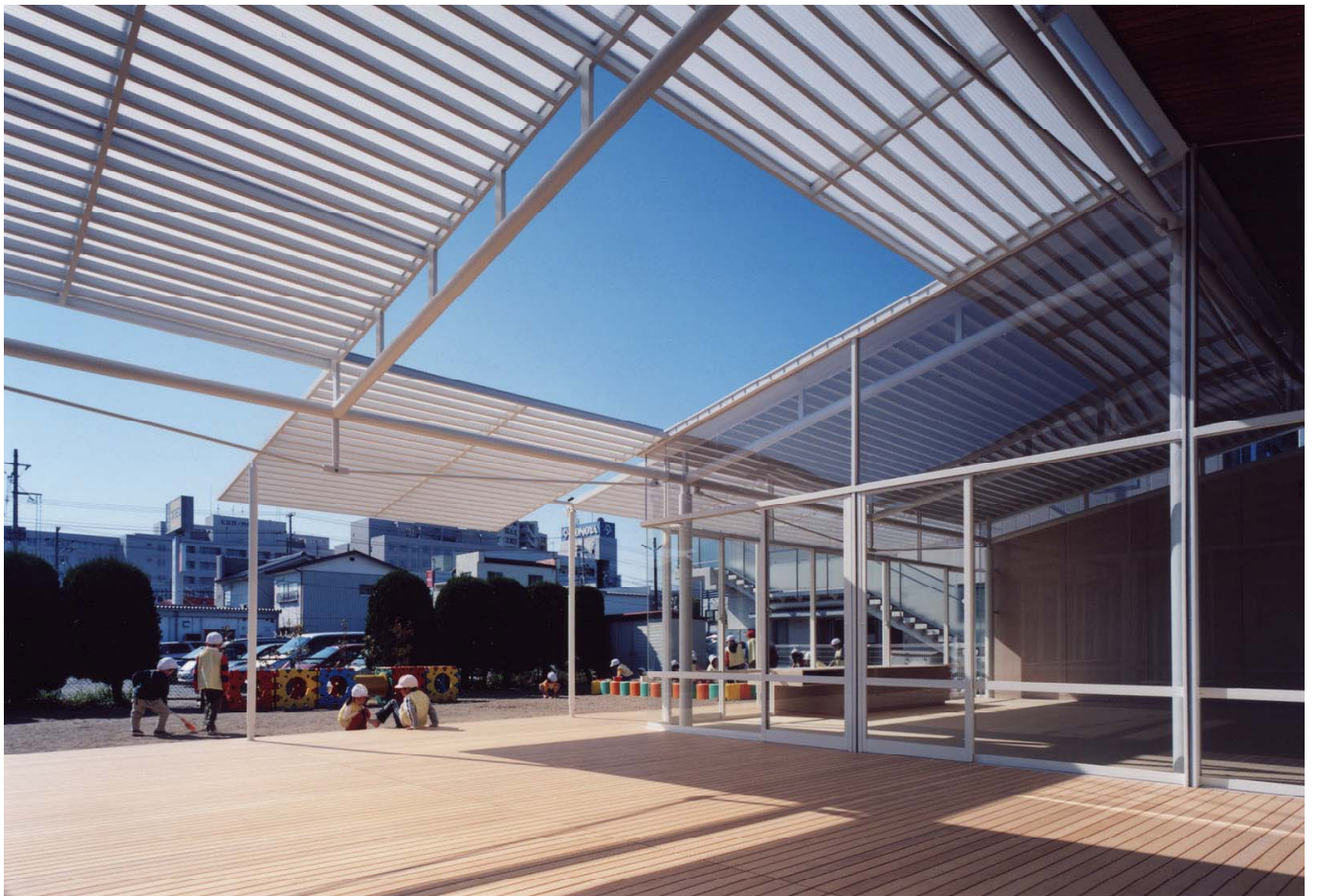
木製テラスをみる view toward wooden terrace