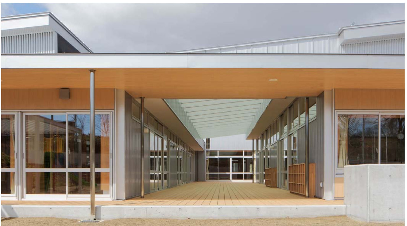
ウッドデッキテラスをみる view toward wooden terrace