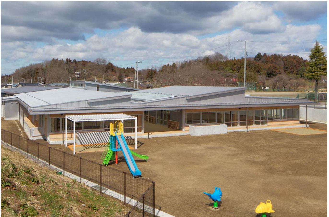
南側外観 view from south