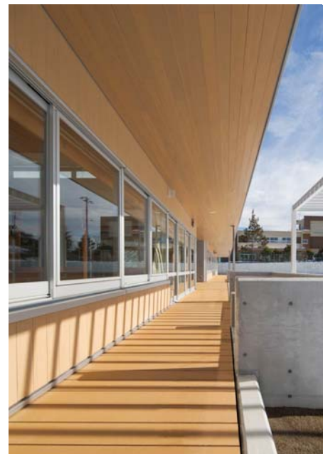
南面ベランダ balcony of south

こども園では、主玄関から送迎される0歳から2歳児の保育室を、西側の里山に守られる静かな位置に配置した。園庭から直接アクセスする年長児の保育室は、東側に計画した。子育て支援センターと遊戯室はこども園の中心に位置し、かつ敷地の中心になるように考慮した。乳幼児の施設では、半外部空間の重要性に力点を置いている。ここでもウッドデッキの一部にトップライトを掛け、雨天時も活動できるように配慮した。福島では放射線の影響を懸念し、外部での遊びができない時期があった。この建物はウッドデッキを介して内部から縁側、半外部空間、園庭へ、そして隣地学校のグラウンドへとつながるイメージが持てるように工夫した。建物は低くおさえ、子どもの身体の大きさや運動量が大きなどころ程天井が迫り上がり、採光性も高めている。勾配屋根は、周辺の里山の稜線に配慮し、ゆるやかな緩勾配で変化している。