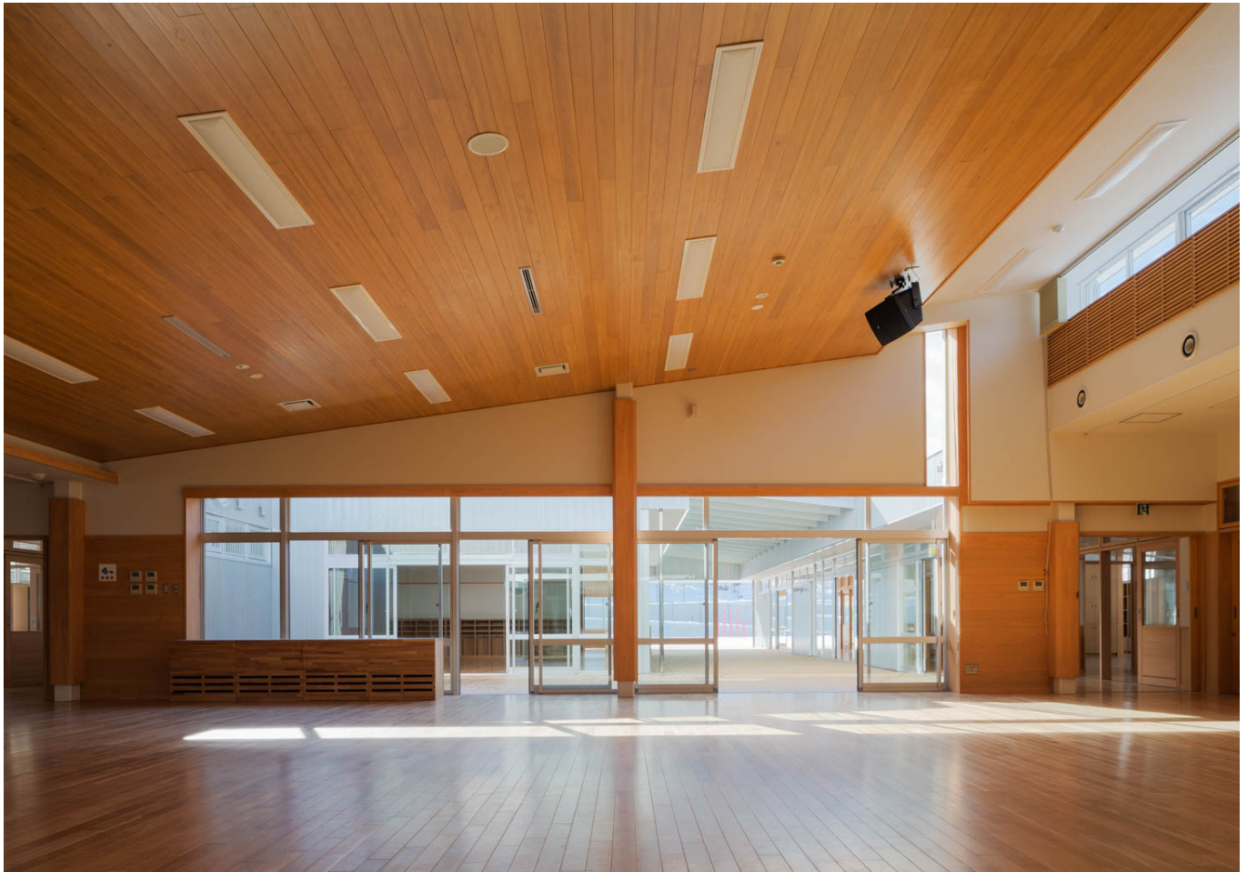
こども園 遊戯室 playroom in kodomoen